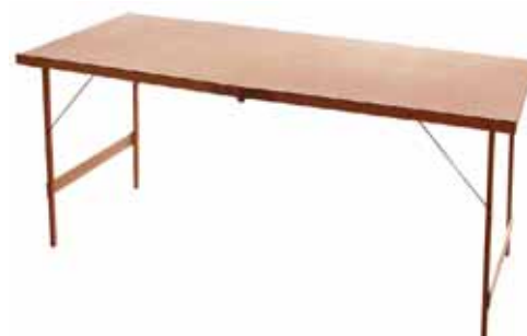
TABLE A TAPISSER PRO

Plateau épaisseur 6 mm. Pieds tubulaires renforcés. Réglet.