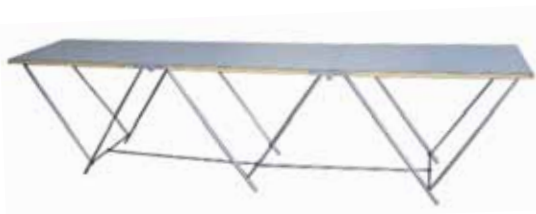
TABLE A TAPISSER PRO