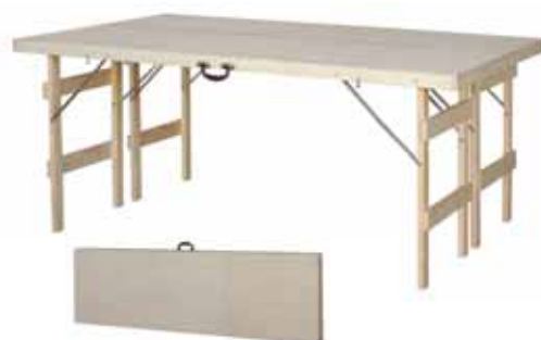
TABLE PLIANTE POUR COLLECTIVITE