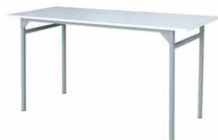
TABLE A TAPISSER