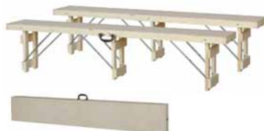
TABLE PLIANTE POUR COLLECTIVITE

Plateau en bois multiplis avec ceinture de renfort. Piètement bois résistant avec nombreuses traverses. Compas de blocage métalliques. Se plie et se dépie rapidement. Très faible encombrement en position pliée. Poignée de transport.