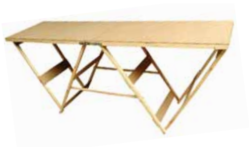
TABLE A TAPISSER PRO